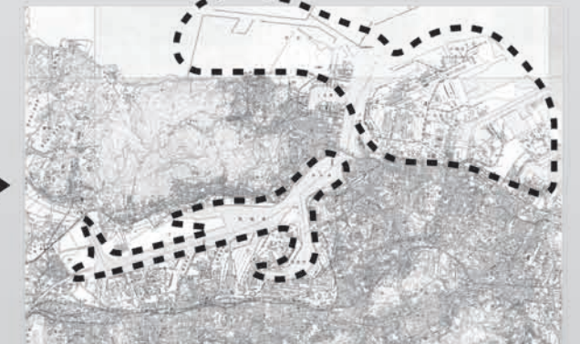
1970年代の洞海湾と響灘