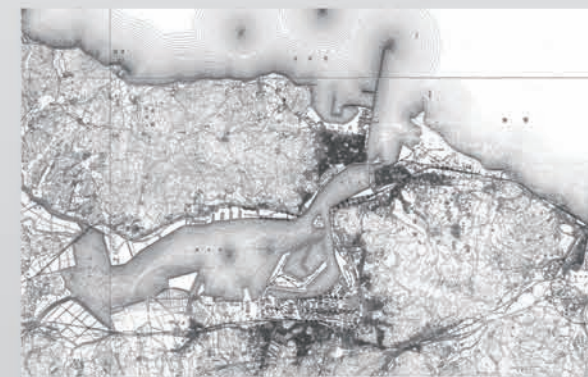
1920年代の洞海湾と響灘